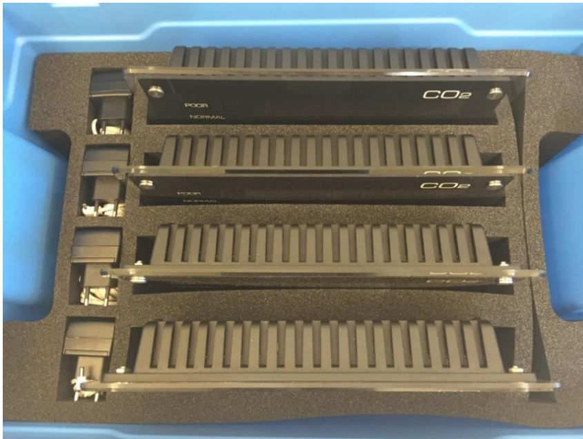
Korrekte Verstaung der Messgeräte

2. Verschiessen Sie die Box und vergewissern Sie sich, dass der Deckel richtig hält.